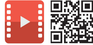
Видеолавҳани QR-код орқали кўринг.

Мамлакатимизда ёшлар сиёсатини янада такомиллаштириш, маҳаллаларда фаолият юритаётган ёшлар етакчиларининг билим ва кўникмаларини оширишга алоҳида эътибор қаратилмоқда.