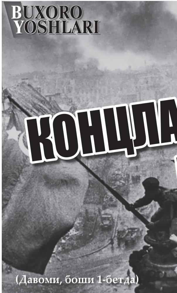
(Давоми, боши 1-бетда)